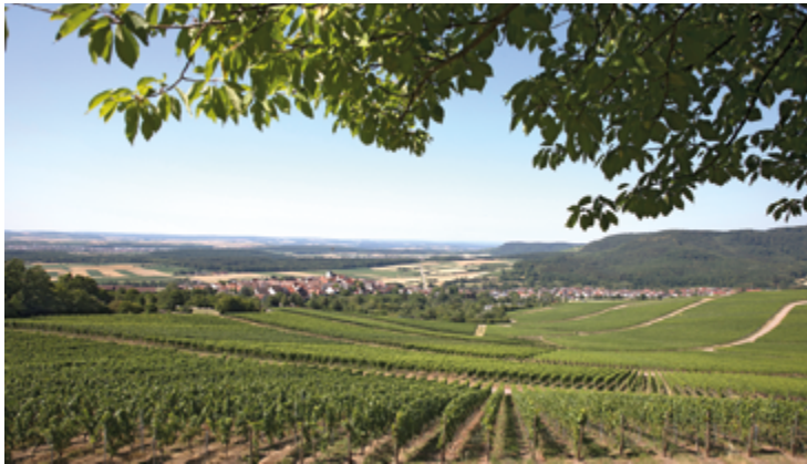
Blick auf Hohenhaslach