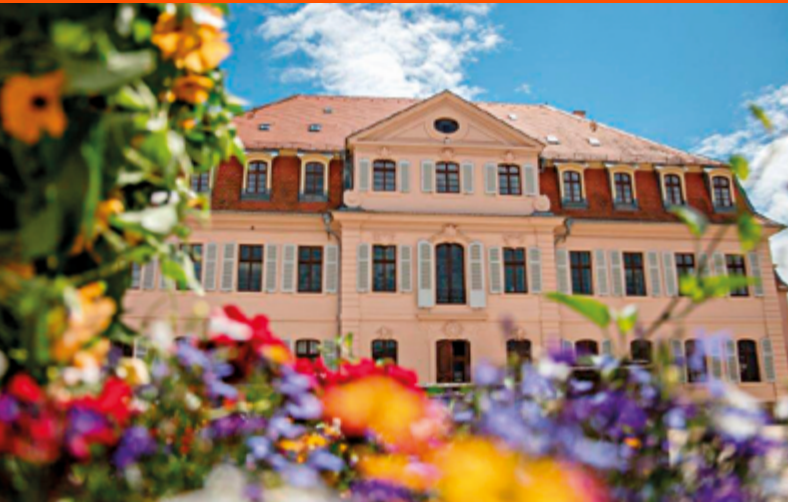
Stadionsches Schloss