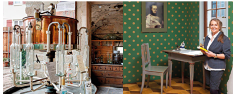
Museum Arzney-Küche

tourist-info@boennigheim.de , www.boennigheim.de